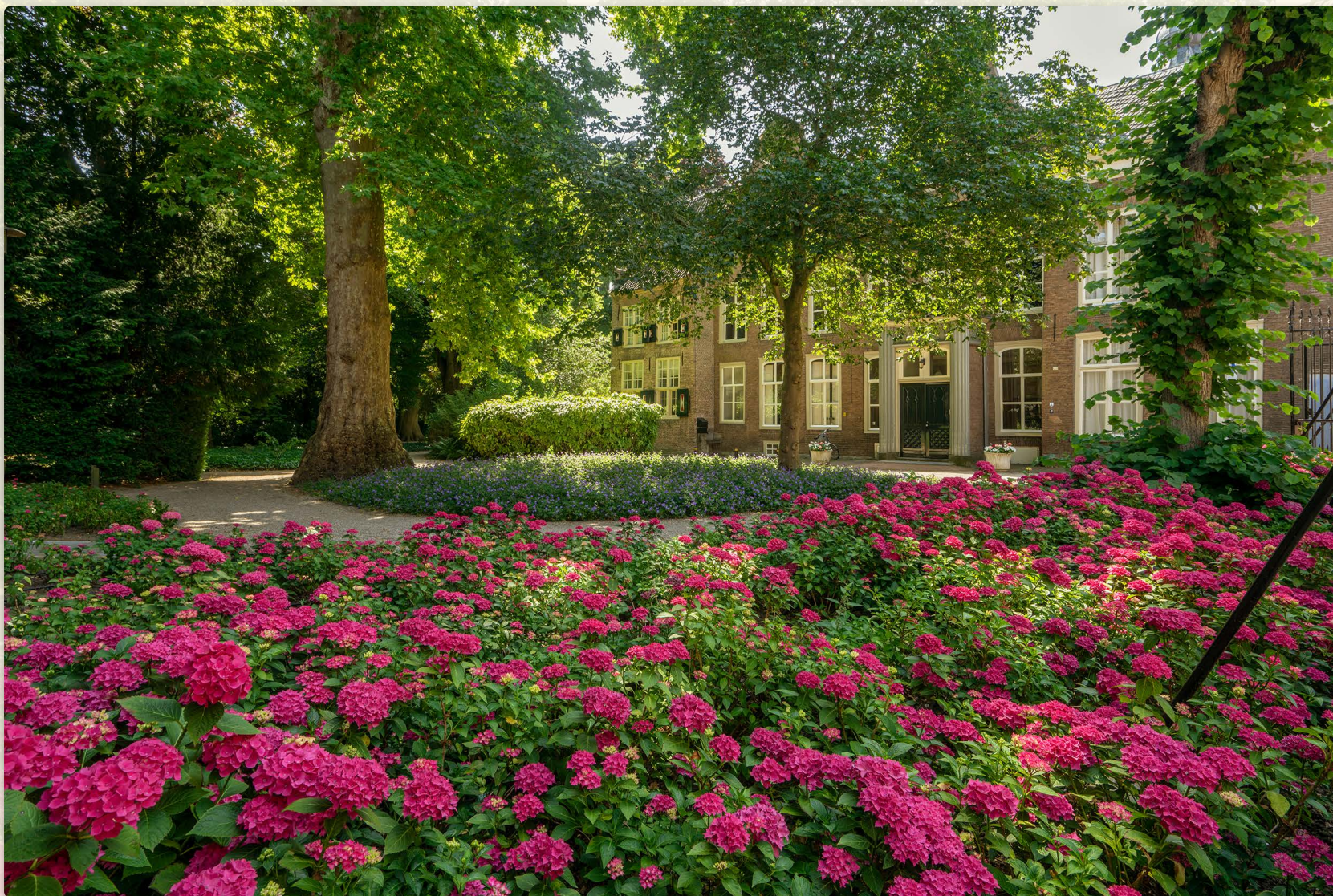
Ambtmanshuis oude bomentuin sprankelende hortensia