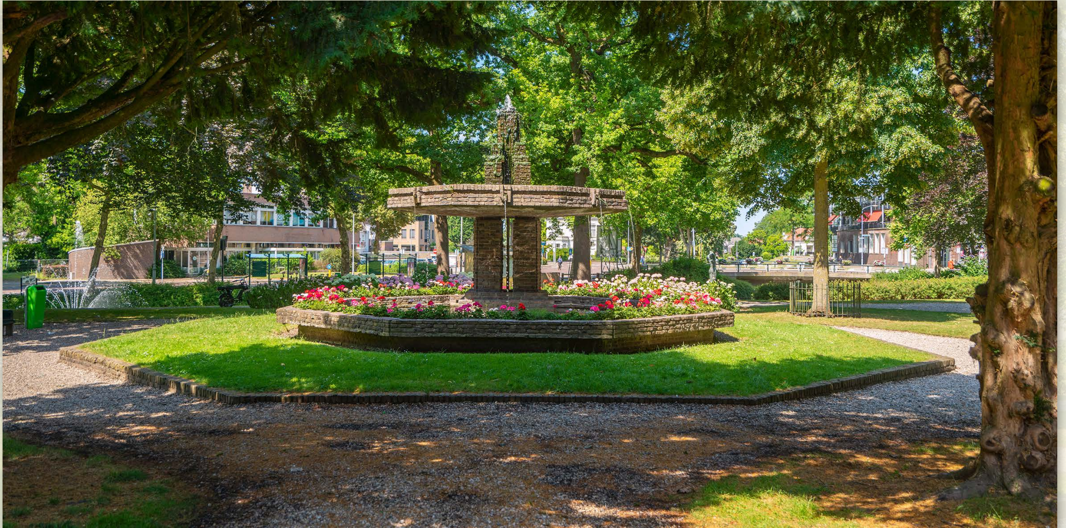
Amsterdamse School Kalverbos fontein