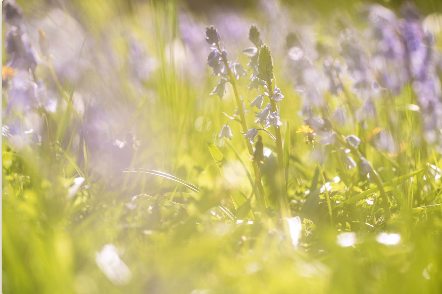
klokjes in het licht twinkelende hoop