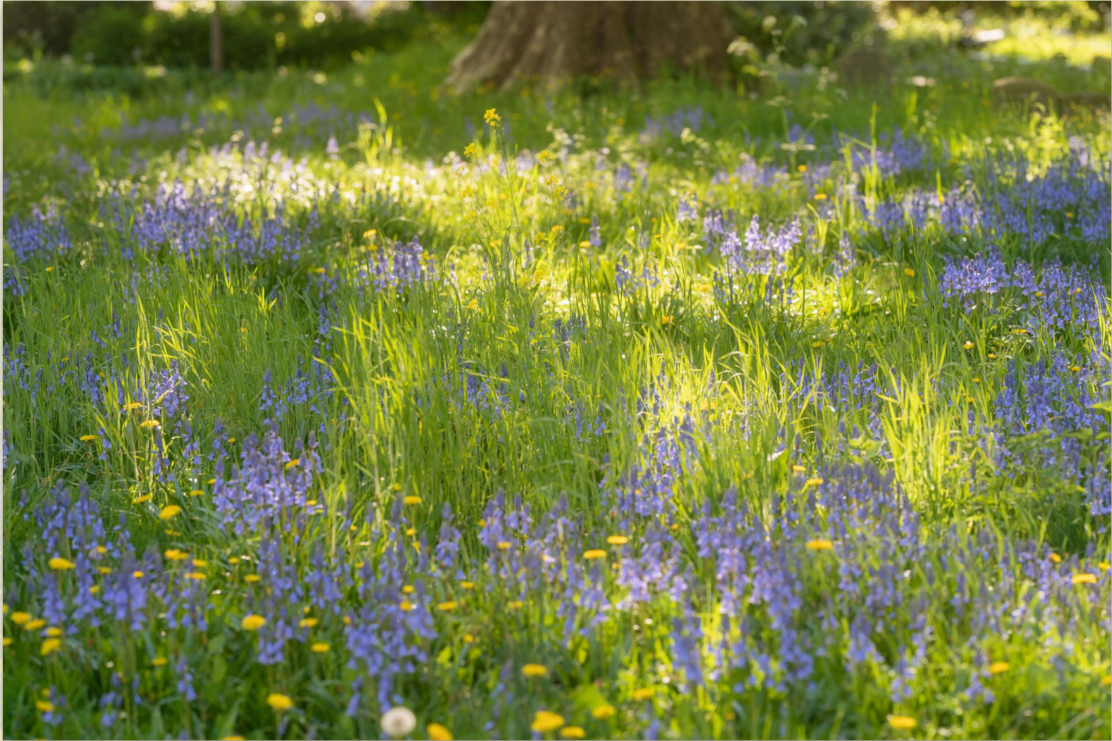
boshyacinten blauwe golf groene hoop