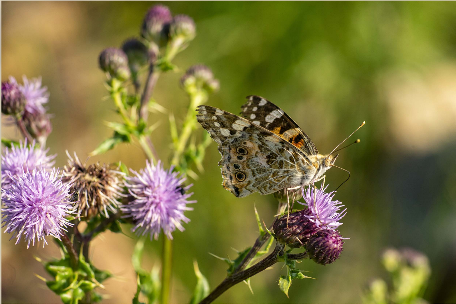
even bijkomen vrolijke fladderaar